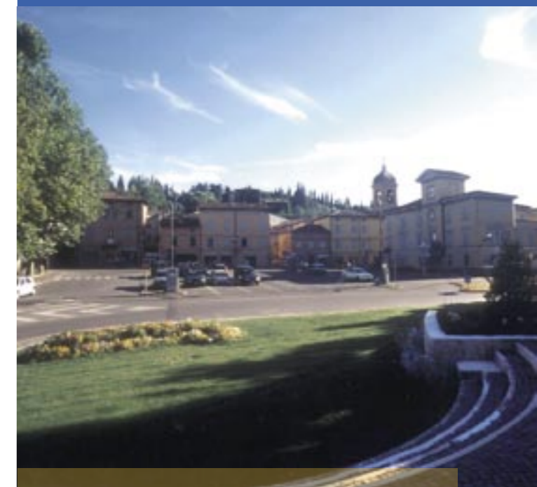
La piazza Ciro Menotti è oggetto di un progetto che definirà anche la viabilità nel centro cittadino

Per questo l’Amministrazione Comunale, nel chiedere ai cittadini di contribuire alle spese per servizi educativi e sociali, ha differenziato il contributo delle famiglie in base al reddito, perché tutti possano accedere e pagare in proporzione alle proprie possibilità.