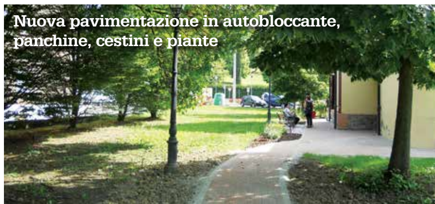
Nuova pavimentazione in autobloccante, panchine, cestini e piante