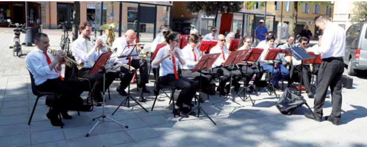
Nelle due foto a sinistra: il 2 Giugno abbiamo festeggiato la Repubblica con il concerto della Banda Flos Frugi e della Corale Rossini di Modena, in un repertorio di cori verdiani.