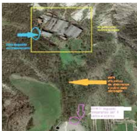
Mappa bonifica dell'amianto de "La Begaia"

tendere che passassero i dieci anni dalla morte del titolare, tempo necessario per dichiarare definitiva la rinuncia all'eredità degli aventi diritto e predisporre il progetto per un intervento diretto da parte del comune, con le necessarie operazioni di bonifica, smaltimento e riordino. I lavori hanno comportato una spesa di 52.000 euro.