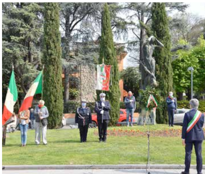
Celebrazioni del 25 aprile 2021