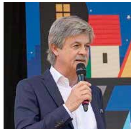
Il Sindaco Francesco Tosi

Auspichiamo una ripresa di iniziative da parte dell'associazionismo in genere e del volontariato. Il Comune ha destinato e sta assegnando un contributo alle associazioni che hanno registrato delle perdite nel corso del 2020, allo scopo di sostenerle nella ripresa delle attività, a dimostrazione dell'importanza che l'Amministrazione assegna al volontariato e al terzo settore come soggetti insostituibili per il bene comune nella solidarietà. Allo stesso modo, sono non poche le risorse che il Comune sta assegnando a coloro che sono stati particolarmente colpiti economicamente dalle conseguenze della pandemia (commercianti e disoccupati). Ciò è stato possibile anche grazie a significativi