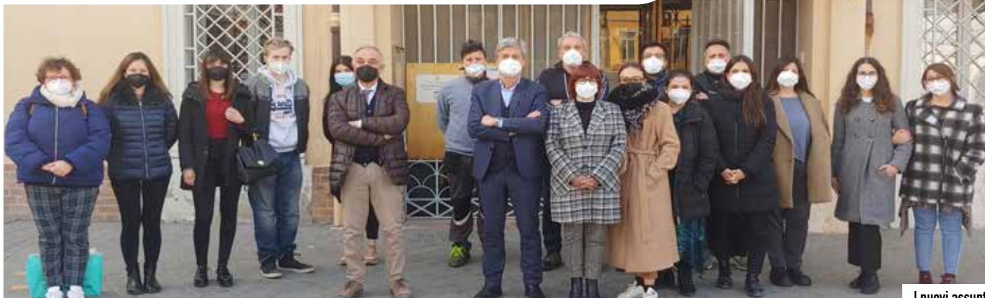
I nuovi assunti

Una interessante opportunità di sviluppo