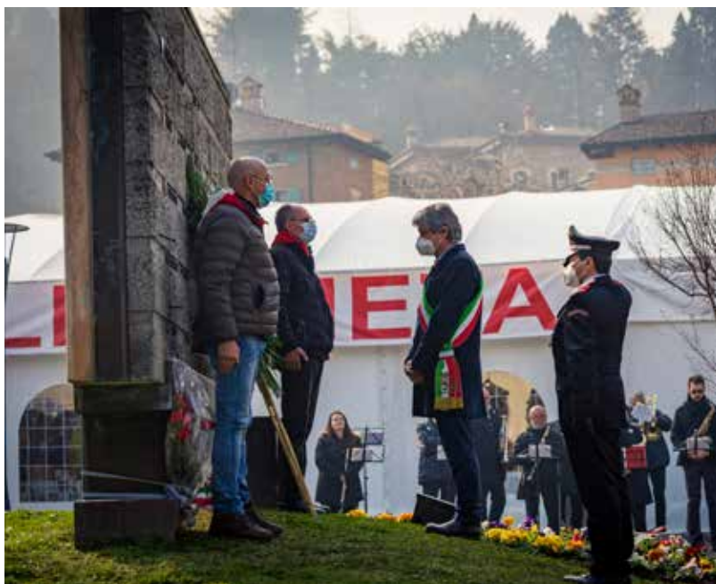
Celebrazione in memoria dell'eccidio del 15 febbraio 1945