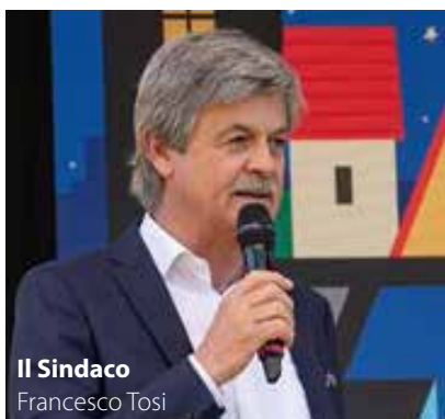
Il Sindaco Francesco Tosi