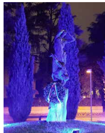
13-14 novembre 2021 Il Monumento ai Caduti, in piazza Ciro Menotti illuminato di blu, per la Giornata Mondiale 2021 contro il diabete.