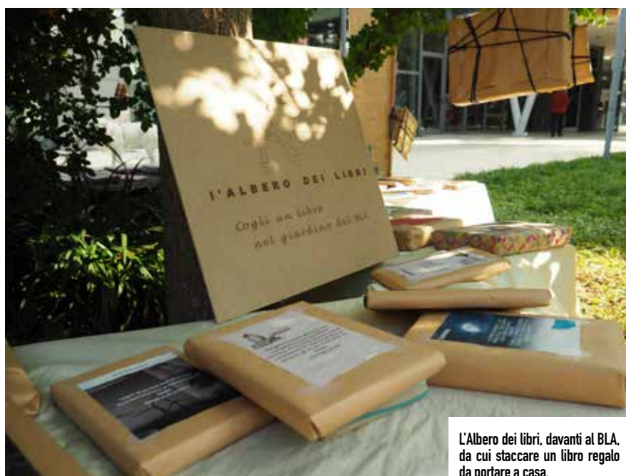
L'Albero dei libri, davanti al BLA, da cui staccare un libro regalo da portare a casa.