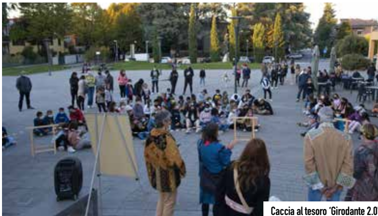
Caccia al tesoro 'Girodante 2.0'