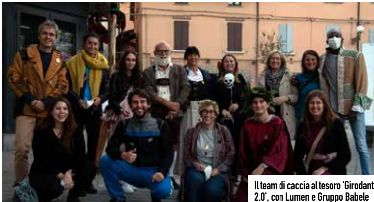
Il team di caccia al tesoro 'Girodante 2.0', con Lumen e Gruppo Babele