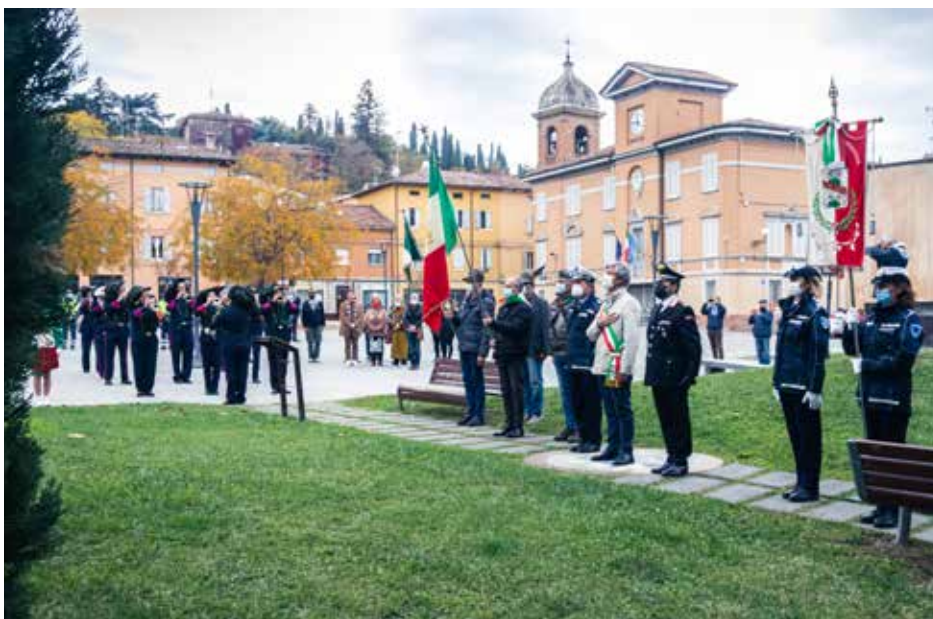
7 novembre 2021 Celebrazioni per la Giornata dell'Unità Nazionale e delle Forze Armate e conferimento della cittadinanza onoraria al Milite Ignoto nel centenario dalla tumulazioni all'Altare della Patria di Roma.