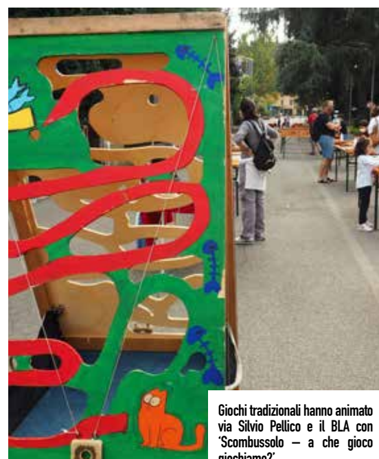
Giochi tradizionali hanno animato via Silvio Pellico e il BLA con 'Scombussolo - a che gioco giochiamo?'