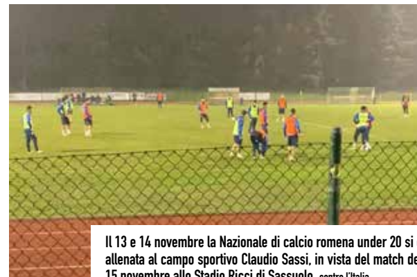
Il 13 e 14 novembre la Nazionale di calcio romena under 20 si è allenata al campo sportivo Claudio Sassi, in vista del match del 15 novembre allo Stadio Ricci di Sassuolo, contro l'Italia.