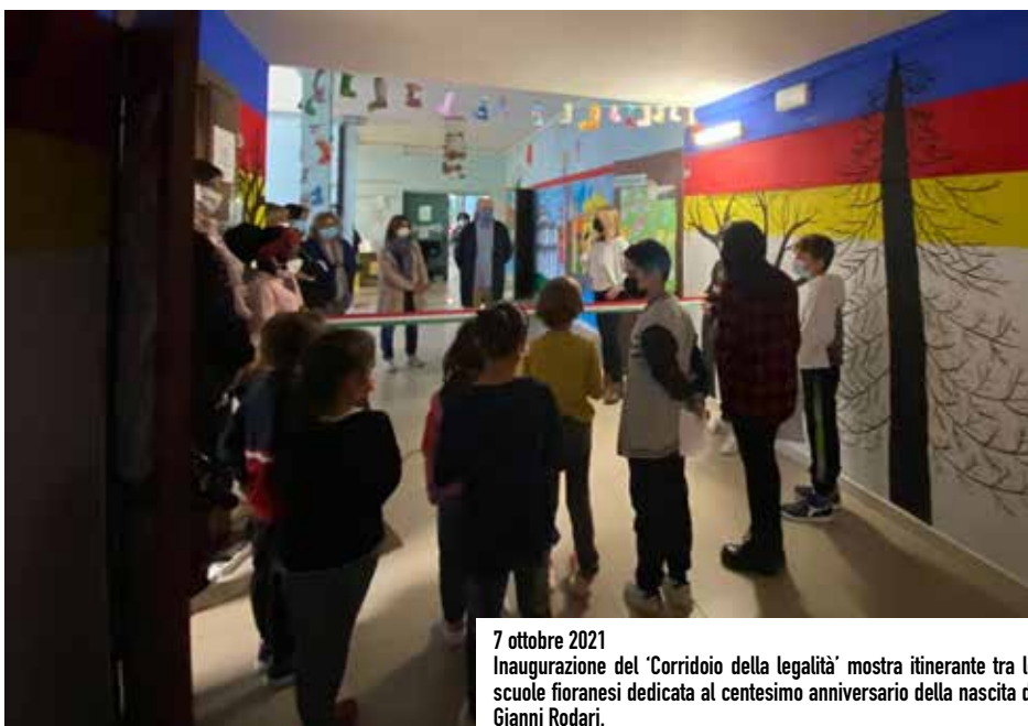
7 ottobre 2021 Inaugurazione del 'Corridoio della legalità' mostra itinerante tra le scuole fiorensi dedicata al centesimo anniversario della nascita di Gianni Rodari.