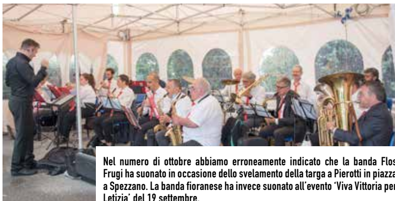
Nel numero di ottobre abbiamo erroneamente indicato che la banda Flos Frugi ha suonato in occasione dello svelamento della targa a Pierotti in piazza a Spezzano. La banda fioranese ha invece suonato all'evento 'Viva Vittoria per Letizia' del 19 settembre.