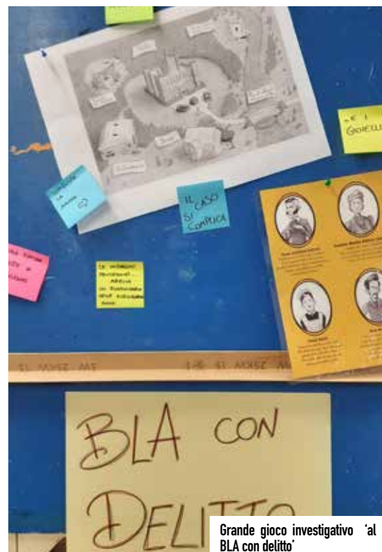
Grande gioco investigativo 'al BLA con delitto'