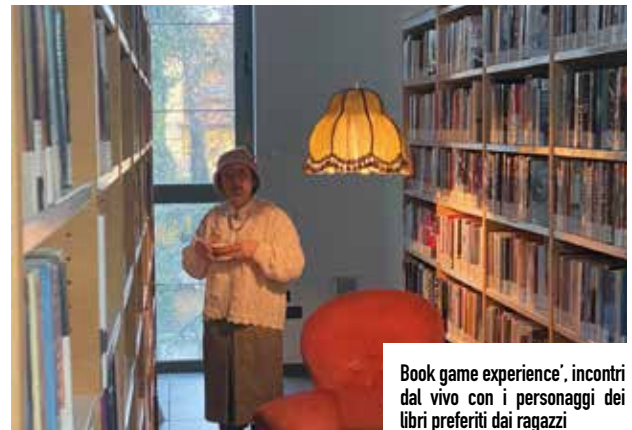
'Book game experience', incontri dal vivo con i personaggi dei libri preferiti dai ragazzi