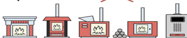
CAMINETTI APERTI, CAMINETTI CHIUSI, STUFE, INSERTI E CUCINE A LEGNA O PELLETT, CALDAIE ALIMENTATE A PELLETT O CIPPATO