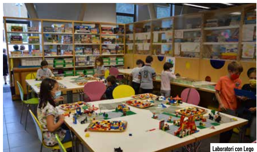
Laboratori con Lego