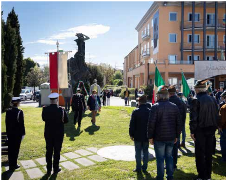
Lunedì 25 aprile , in piazza Ciro Menotti, le celebrazioni istituzionali per la Festa della Liberazione: Santa messa nella chiesa parrocchiale di Fiorano, posa della corona al Monumento ai caduti e il trekking urbano 'Senti che storia, dalla Resistenza alla Costituzione' a cura di ANPI e ARCI, con la partecipazione delle classi quinte delle scuole di Fiorano e Spezzano.

La revoca della cittadinanza a Mussolini emendata è stata approvata con il voto favorevole dei consiglieri presenti, con una sola astensione.