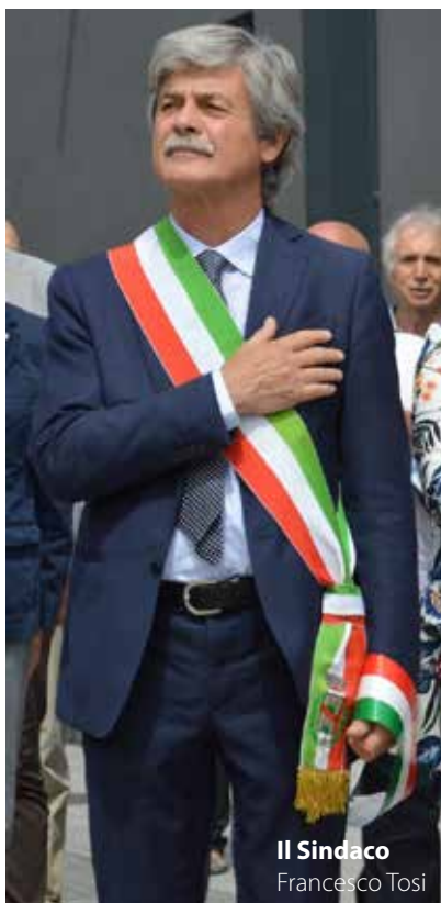
Il Sindaco Francesco Tosi