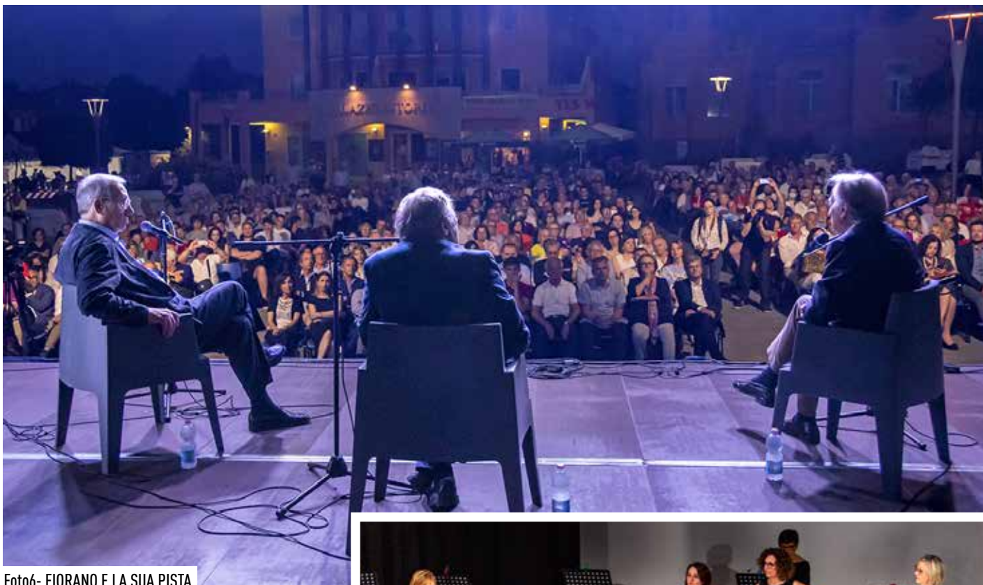
Foto6- FIORANO E LA SUA PISTA