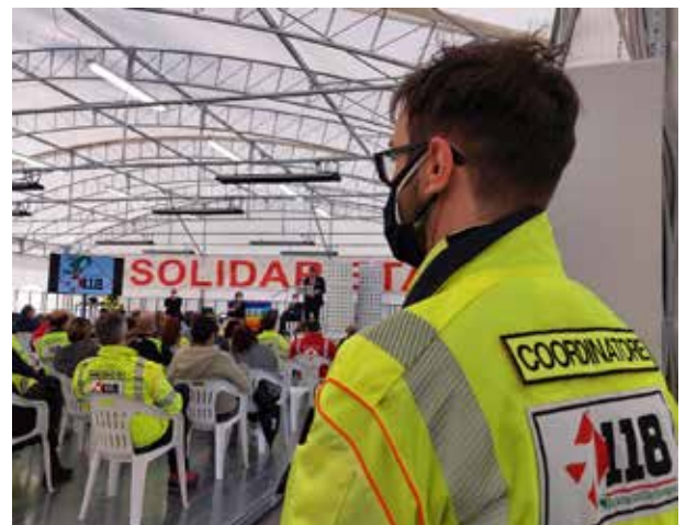
Convegno per i 30 anni del 118, al Pala AVF organizzato dalla Aust di Modena per raccontare la storia del 118 negli anni attraverso testimonianze (27 marzo 2022).