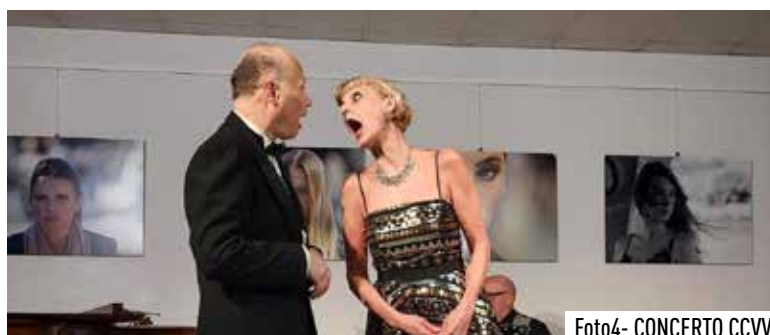
Foto4- CONCERTO CCVV