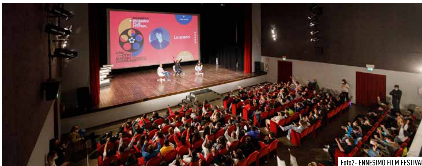
Foto2- ENNESIMO FILM FESTIVAL