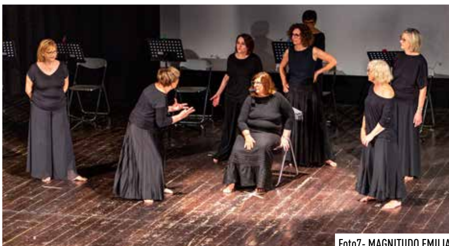
Foto7- MAGNITUDO EMILIA

Nel mese di maggio anche tanti spettacoli e incontri al teatro Astoria organizzati dalle associazioni del territorio, in collaborazione con il Comune, che hanno "occupato" il teatro quasi tutti i giorni del