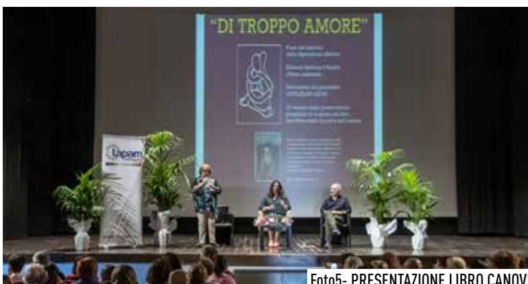
Foto5- PRESENTAZIONE LIBRO CANOVI

Tra marzo, aprile, maggio e giugno sono tornati a teatro e nel pala AVF e poi sul palco in piazza Ciro Menotti gli appuntamenti con ANDAM A VEGG lo spettacolo dei ricordi, con musica, cabaret e divertimento vario. In particolare il 26 maggio con una puntata tutta dedicata agli Alpini (foto 3).