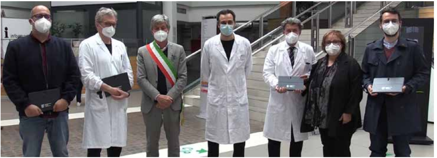
Consegna di 4 tablet all'ospedale di Sassuolo, donati da Ennesimo Film Festival, che consentiranno ai ragazzi e ai bambini di avere a disposizione, durante la degenza, strumenti all'avanguardia per le attività ludiche e per quelle didattiche della scuola ospedaliera (7 maggio).