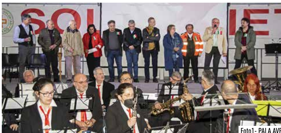
Foto1- PALA AVF

ogni giorno eventi gratuiti per grandi e piccoli, attorno al concetto di spazio, tema clou di questa ottava edizione. Tantissimi ospiti importanti, come l'architetto Valentina Sumini, lo scrittore Paolo Nori, Lodo Guenzi dello Stato Sociale, l'attrice Eleonora Giovanardi e come sempre tanto pubblico. Una attenzione particolare agli studenti e al lavoro fatto nelle scuole in questo anno con Ennesimo Film Academy (foto 2).