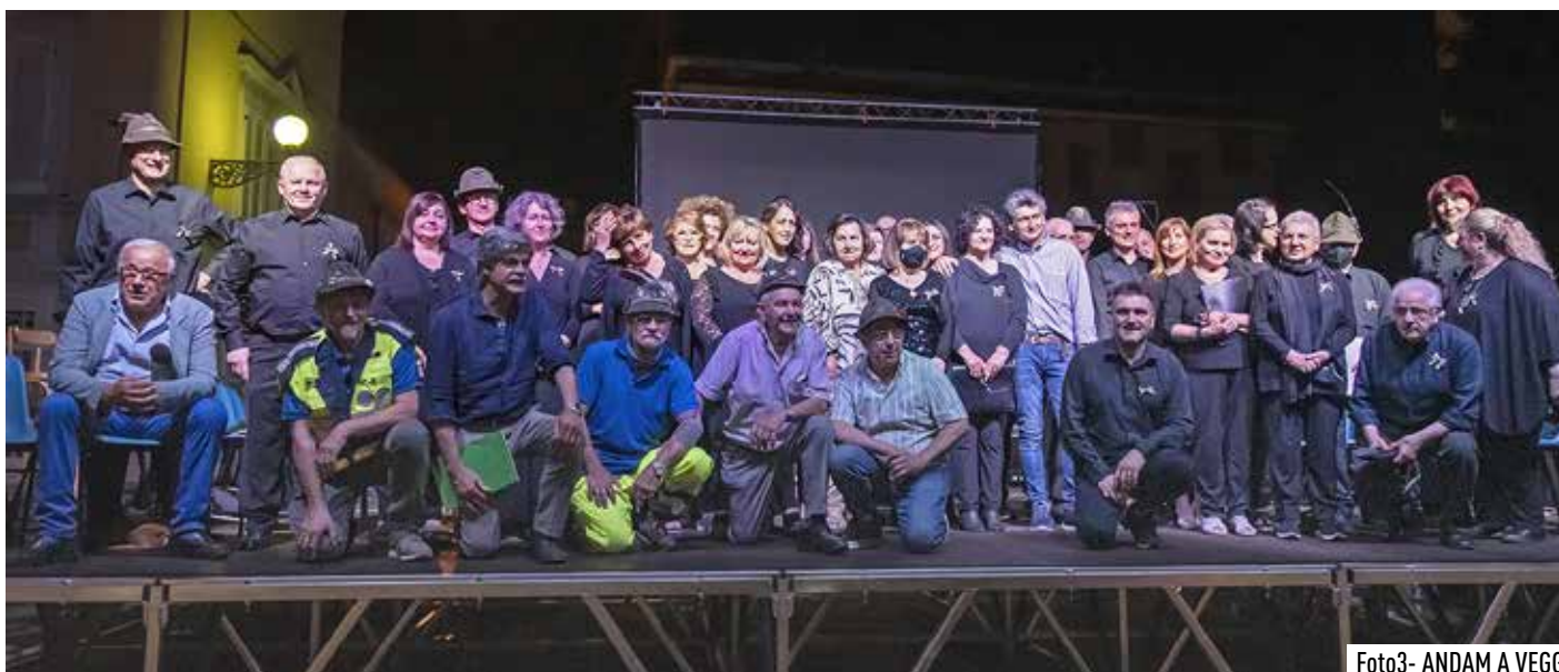
Foto3- ANDAM A VEGG